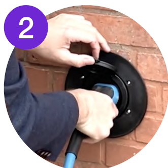
2 Kablet slutes til laderen i væggen