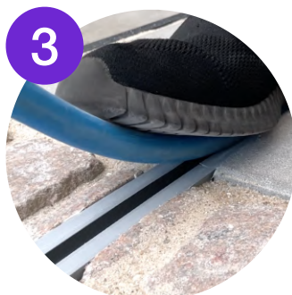
3 Kablet sættes fast i Elbys fortovsskinne