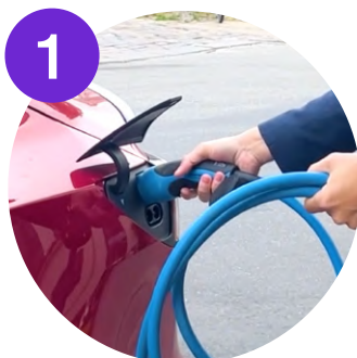
1 Bilejeren slutter sit eget kabel til bilen